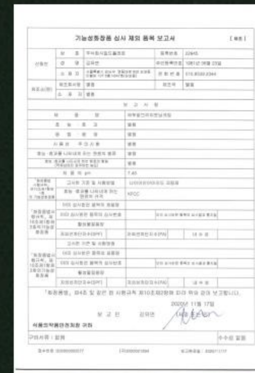
에뚜알 브라이트닝 크림 기능성 화장품 인증서