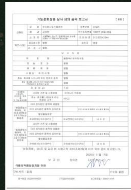
블랑쉬 리페어링 크림 기능성 화장품 인증서